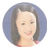
Ms. Oi × (BBC World News)